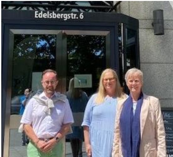
Staatsempfang für die Pflege 200 Jahre Florence Nightingale