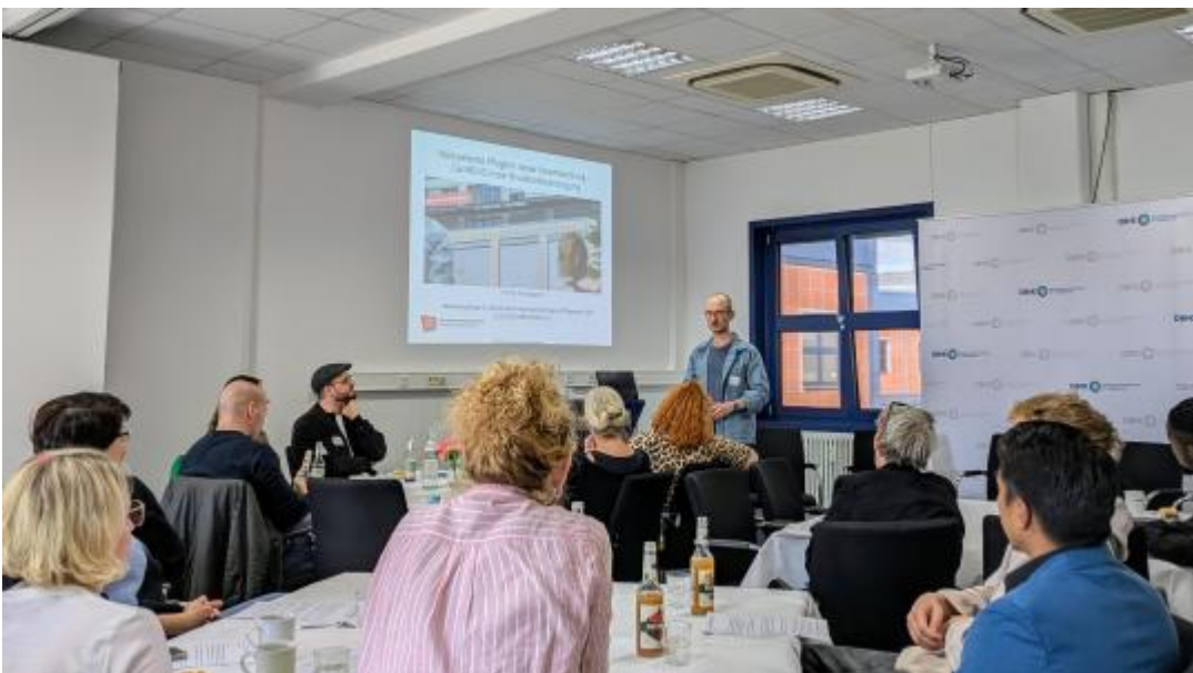
Am 12. Mai lädt der DBfK Nordost seine Mitglieder und alle Interessierten um 17 Uhr ins Berliner Haus der Gesundheitsberufe ein. Wir diskutieren die Relevanz der Befugnisserweiterung am Beispiel eines der