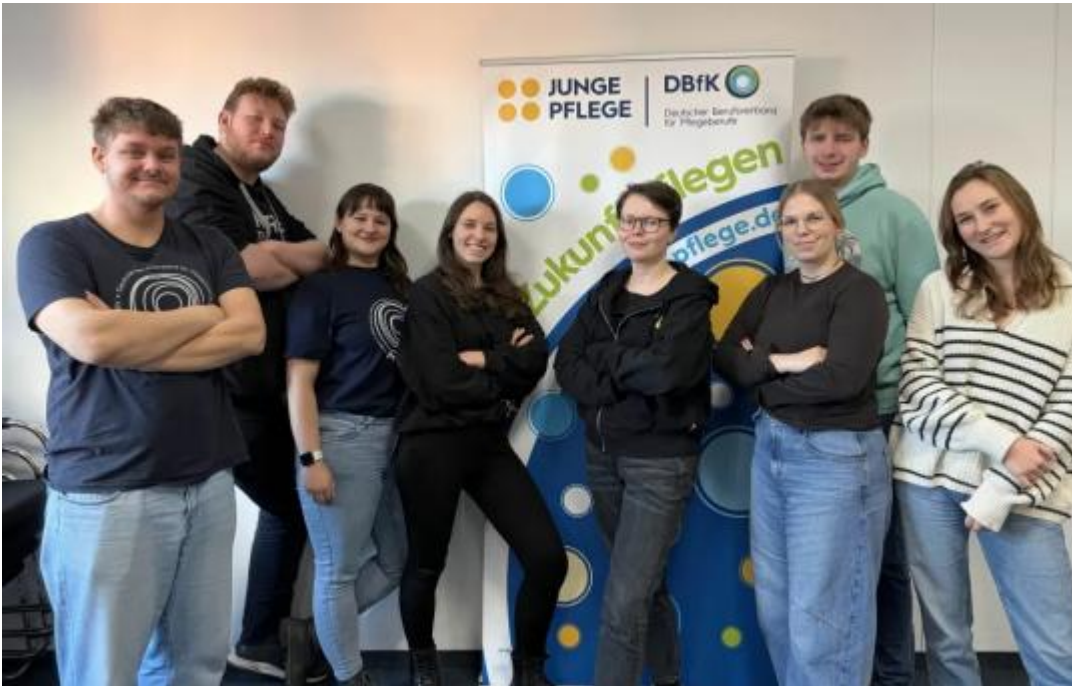
Die Lenkungsgruppe Junge Pflege erwartet euch im Oktober zum Forum Junge Pflege in Berlin.