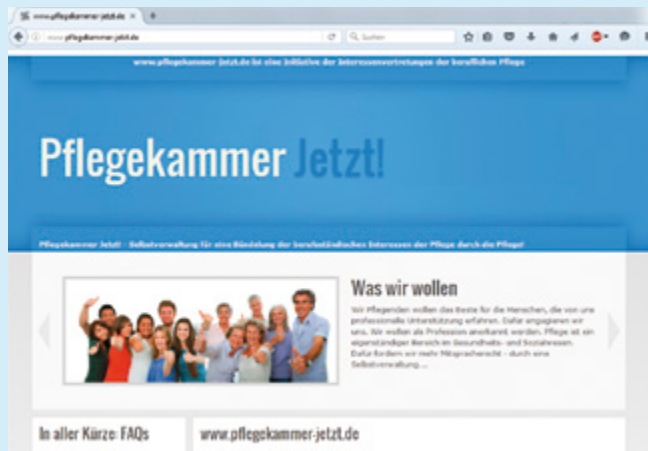
Abb. Fotolia.com: Andrey Popov_Titel, pojoslav_S4o und über DBfK